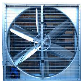
EI 1220 Extractor Industrial.