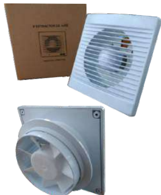
EB 6 Extractor de baño.