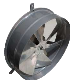
EP 30 ME Para pared.