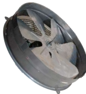
EP 35 ME C/R Para pared.