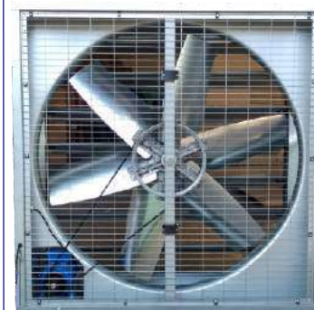
EI 1380 Extractor Industrial.