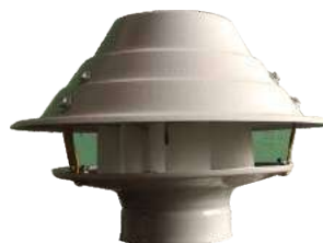
EC 380 Para fin de conducto.