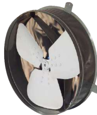
H 76-900 M - H 76 T Helicoidal.