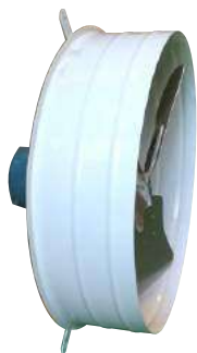
H 52 M - H 52 T Helicoidal.