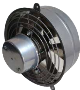
EP 25 ME C/R Para pared.