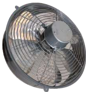
EP 30 ME C/R Para pared.