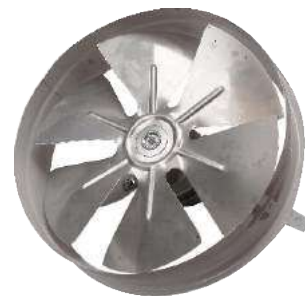
EP 40 ME Para pared.