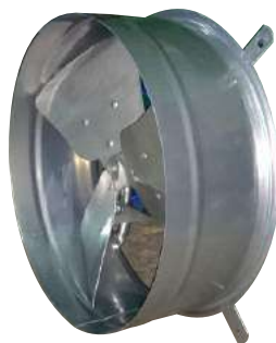
H 35 M - H 35 T Helicoidal.