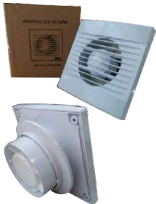
EB 4 Extractor de baño.