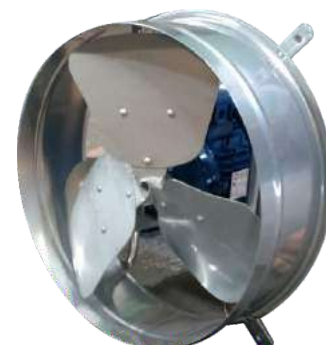
H 45 M - H 45 T Helicoidal.