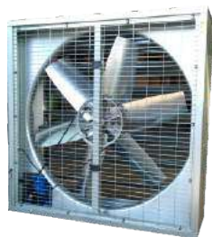
EI 900 Extractor Industrial.