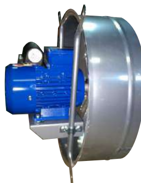
H 40 M - H 40 T Helicoidal.