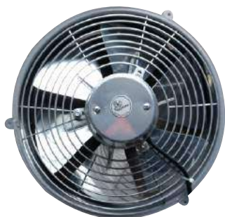
EP 40 ME C/R Para pared.