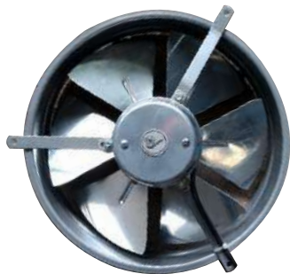
EP 35 ME Para pared.