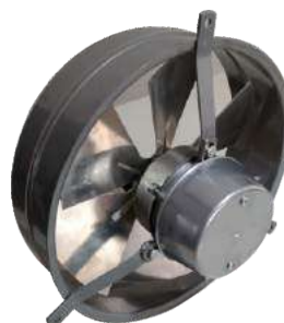
EP 25 ME Para pared.