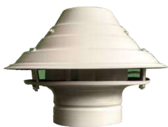
EC 1000 Para fin de conducto.